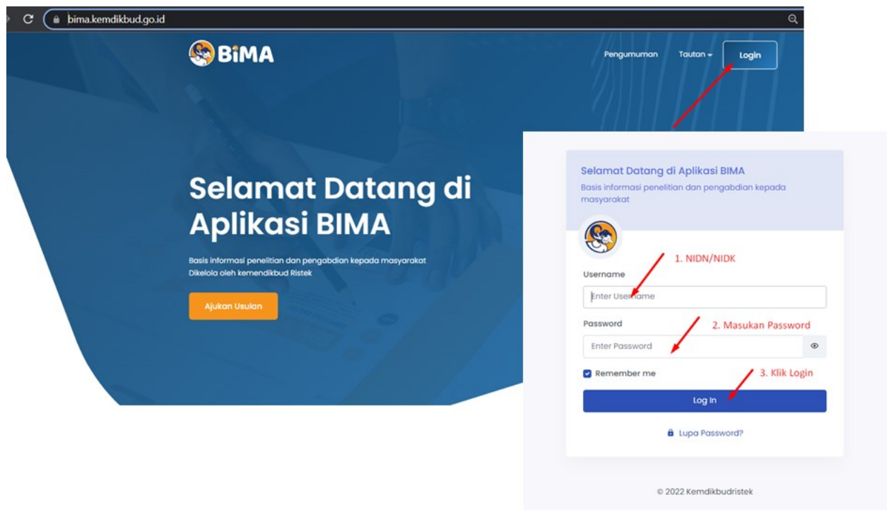
Gambar 1. Beranda akses memasuki aplikasi BIMA

Penerima pendanaan penelitian dan pengabdian kepada masyarakat di Perguruan Tinggi Akademik Tahun Anggaran 2022, wajib melakukan revisi proposal, rencana anggaran biaya (RAB), dan mengunggah surat pernyataan kesanggupan pelaksanaan melalui aplikasi BIMA pada laman http://bima.kemdikbud.go.id/ dengan menggunakan akun ketua pengusul masing-masing, sebagaimana diperlihatkan pada Gambar 1.