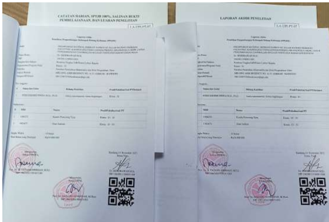
Gambar 2. Lembar pengesahan yang ditandatangani basah oleh ketua Peneliti/PkM, Dekan/Direktur, dan ketua LPPM