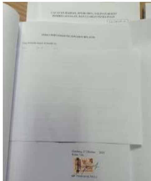
Gambar 3. SPTJB 100% asli (1 jilid)