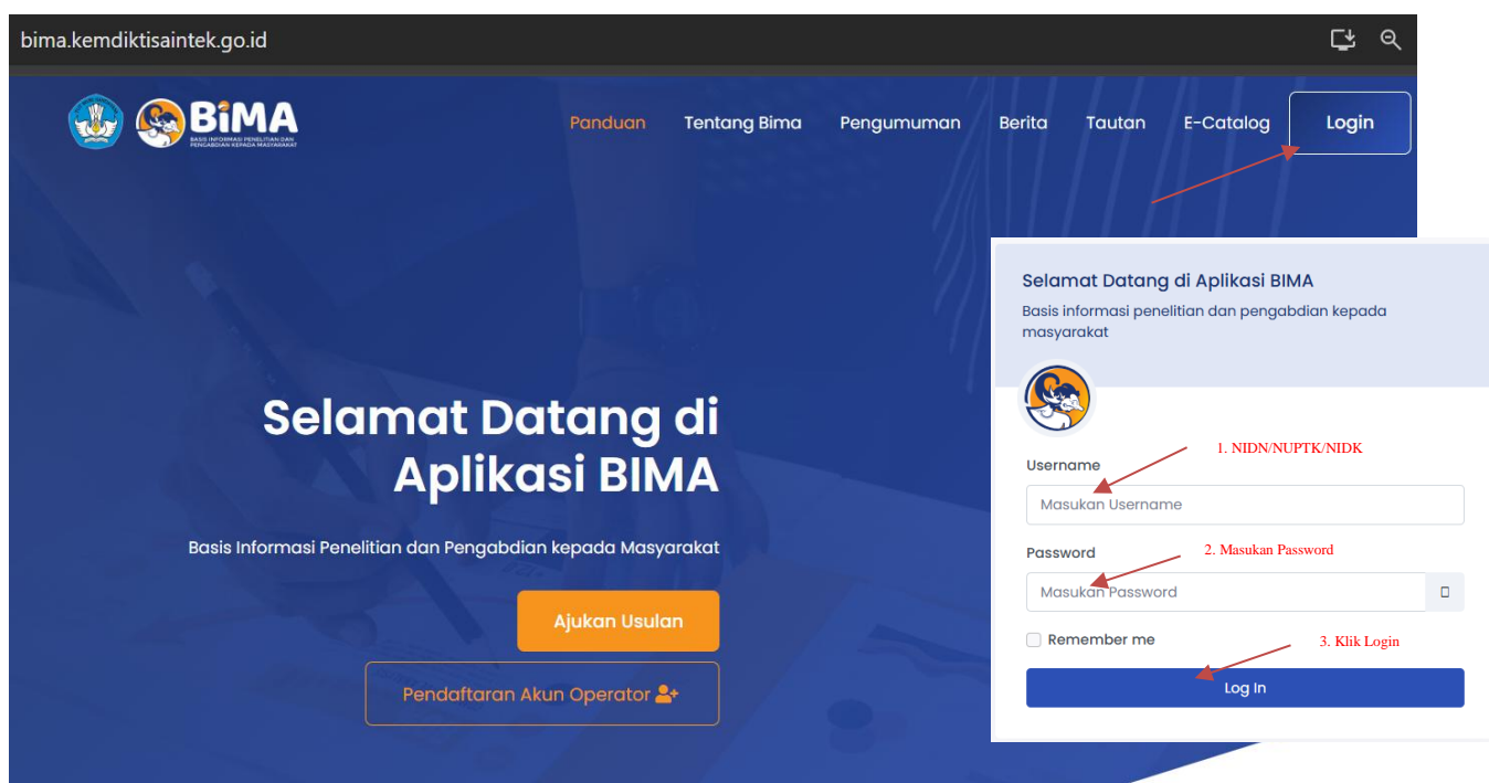
Gambar 1. Beranda akses memasuki aplikasi BIMA

Penerima pendanaan penelitian dan pengabdian kepada masyarakat di Perguruan Tinggi Tahun Anggaran 2025 wajib melakukan revisi proposal, rencana anggaran biaya (RAB), dan mengunggah surat pernyataan kesanggupan pelaksanaan melalui aplikasi BIMA pada laman https://bima.kemdiktisaintek.go.id/ dengan menggunakan akun ketua pengusul masing-masing, sebagaimana diperlihatkan pada Gambar 1.